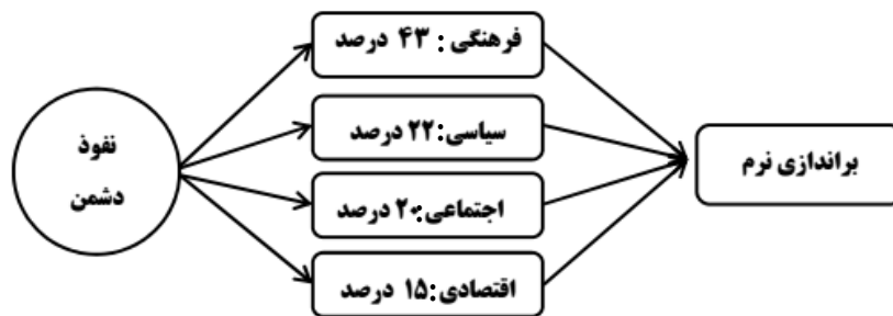
شکل ۲. عرصه‌های نفوذ به ترتیب اولویت

شکل (۲) گونه‌های نفوذ را براساس اهمیت و درصد اولویت آن از منظر رهبر معظم انقلاب به تصویر کشیده است. براساس بیانات معظم له از بین عرصه چهار گانه نفوذ، عرصه فرهنگی بدلیل تأثیر بر سایر عرصه‌ها از اهمیت و جایگاه مهمی برخوردار است. چون دارای لایه‌هایی پیچیده‌ای است که نیاز به هشیاری و ظرافت خاصی دارد.