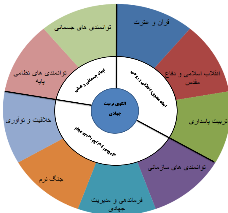
مدل مفهومی تحقیق (الگوی تربیت جهادی دانشجویان دانشگاه افسری و تربیت پاسداری امام حسین (ع))