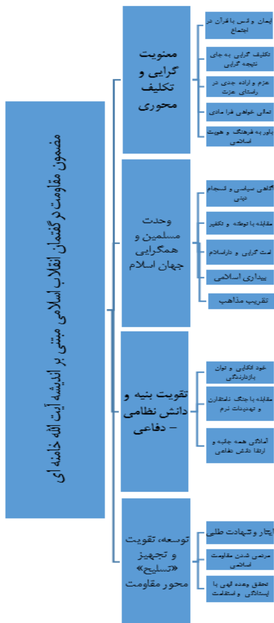
نمودار ۱. شبکه مضمونی مقاومت اسلامی در اندیشه مقام معظم رهبری